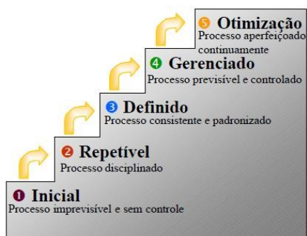
Figura 1 – Os cinco níveis da maturidade do Processo de Software.